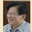
川勝 平太 静岡県知事